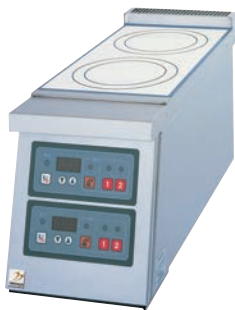
⑦IHマルチコンロ 74 直A 納期 ページコード 商品コード 価格 FIC23602A 4-0803-0701 2145310 ¥413,000

外形:230×600×H300 IHユニット:1.3kW×2 電源:単相200V 総合消費電力:2.64kW 定常時最大電流:15A 重量:19kg コンセント形状: (C) 対応鍋底サイズ:φ150~φ180 ●必要な電力だけを使用する省エネ設計 ●省スペース設計です。 ●清掃しやすい構造です。 ●プログラム調理と手動調理の両方が可能です。