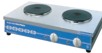
⑥電気コンロ 94 直B 納期 ページコード 商品コード 価格 THP-2W 4-0803-0601 5886300 ¥114,000