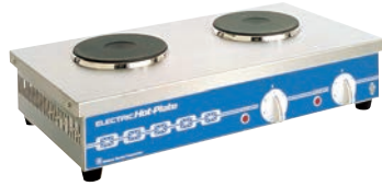
⑤電気コンロ 94 直B 納期 ページコード 商品コード 価格 THP-1W 4-0803-0501 5886200 ¥95,000