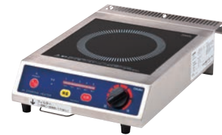
⑨IH小型 卓上コンロ 84 直A 納期 ページコード 消費電力 商品コード 価格 DB20SAB 4-0803-0901 2.0kW 6704900 ¥98,000 DB25SAB 4-0803-0902 2.5kW 6705000 ¥128,000

外形:300×450×H110 電源:単相 200V 50/60Hz 重量:6.2kg 対応鍋底サイズ:φ120~φ240 ●保温機能付 ●便利な保温設定機能付で、様々な調理に対応