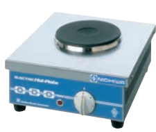
①電気コンロ 90 直B 納期 ページコード 商品コード 価格 THP-1 4-0803-0101 5885800 ¥51,000