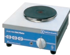
②電気コンロ 94 直B 納期 ページコード 商品コード 価格 THP-2 4-0803-0201 5885900 ¥60,000