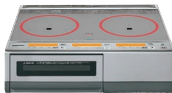
⑧パナソニック IH クッキングヒーター ロースター付 74 ページコード 商品コード 価格 KZ-KG22E 4-0803-0801 6212850 ¥178,000

外形:230×600×H300 IHユニット:1.3kW×2 電源:単相200V 総合消費電力:2.64kW 定常時最大電流:15A 重量:19kg コンセント形状: (C) 対応鍋底サイズ:φ150~φ180 ●必要な電力だけを使用する省エネ設計 ●省スペース設計です。 ●清掃しやすい構造です。 ●プログラム調理と手動調理の両方が可能です。